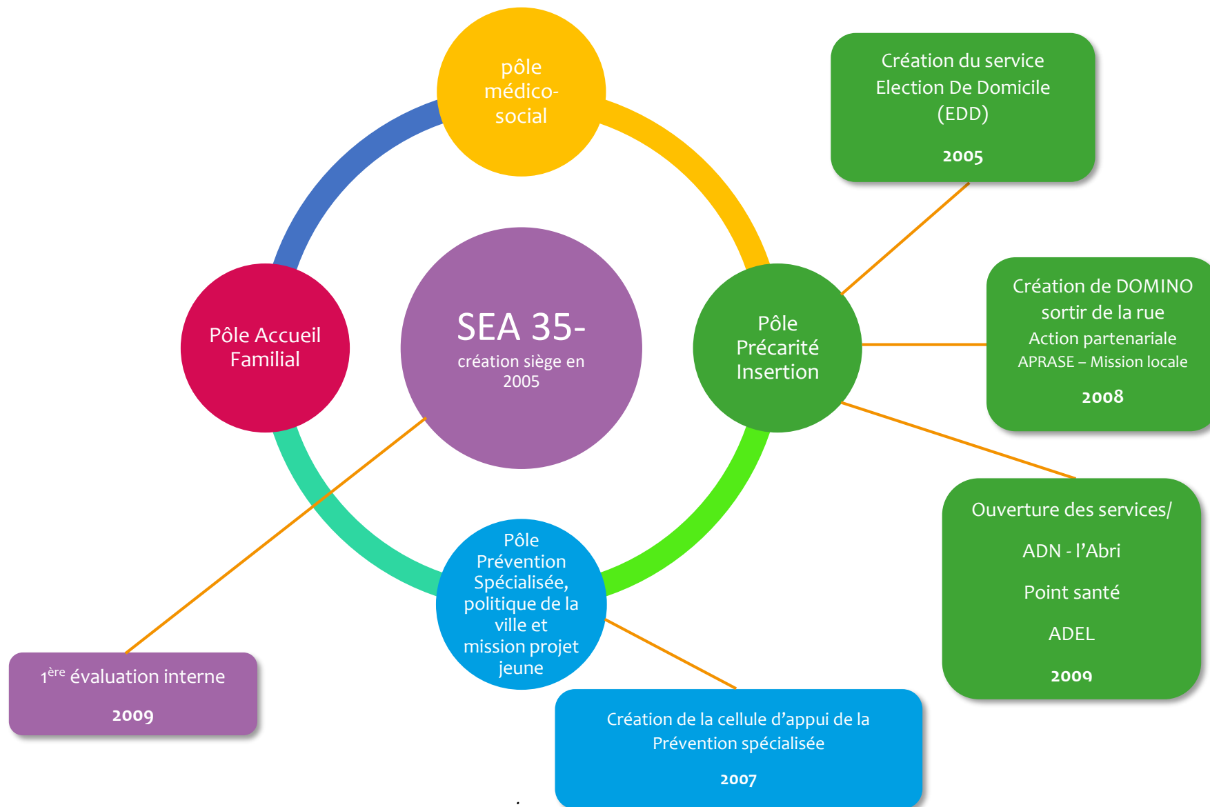
Figure 4- Evolution de l'institution SEA 35, par sa structuration en services de 2005 à 2009.